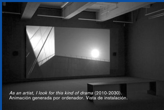
As an artist, I look for this kind of drama (2010-2030). Animación generada por ordenador. Vista de instalación.